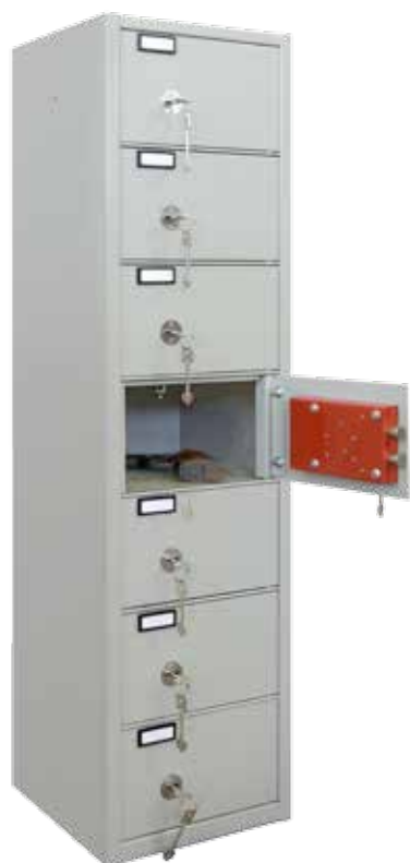
1 Vano 3 Vani 7 Vani

Da inserire in armadi modulari o assemblabili tra di loro To be inserted in cabinets for modular system or between them