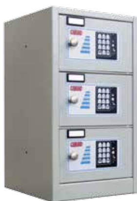
1 Compartment steel locker 3 Compartments steel locker 7 Compartments steel locker